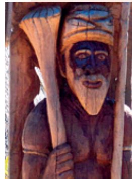
Détail d'un poteau sculpté.

Chacune des huit aires coutumières dispose d'un conseil coutumier consultatif, qui peut être saisi en cas de litige sur un palabre. Le palabre est une décision prise collectivement, dont le procès-verbal est établi par l'officier public coutumier. Celui-ci peut rédiger des « actes coutumiers » autorisant notamment le chef de clan à conclure un accord en vue d'un projet de développement sur terres coutumières ou à statuer sur la dissolution d'une union coutumière, la répartition des terres dans le cadre d'une succession, voire sur un accord entre clans.