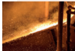
L'usine métallurgique du Koniambo, située en Province Nord, est entrée en production le 19 avril 2013.

L'assemblée de la Province Nord compte 22 membres dont 15 au Congrès et celle de la Province Sud 40 membres dont 32 au Congrès. L'assemblée provinciale élit, parmi ses membres, un exécutif composé d'un président ainsi qu'un bureau comprenant trois vice-présidents. Ses séances sont publiques. L'assemblée administre la Province, adopte des règlements et vote le budget. Ses actes ont la forme de délibérations. L'État est représenté aux assemblées par le Haut-commissaire, ou son délégué, qui assiste aux séances et peut demander au président l'inscription d'une question à l'ordre du jour. Le président de l'assemblée est l'exécutif de la Province. Il prépare et exécute les délibérations de l'assemblée.