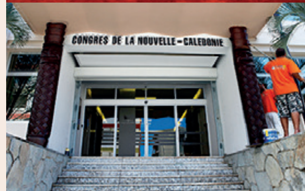
L'immeuble du Congrès, situé boulevard Vauban. Vues intérieure et extérieure.