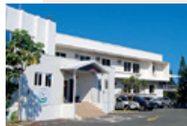
La justice fait partie des compétences régaliennes. Palais de justice de Nouméa.

Le Haut-commissaire assure le contrôle administratif des institutions de la Nouvelle-Calédonie, des Provinces, des communes et des établissements publics.