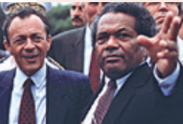
Michel Rocard et Jean-Marie Tjibaou.