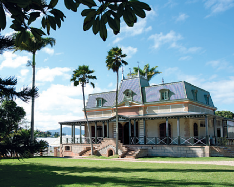
Classé monument historique, le Château Hagen a été construit à la fin du XIX e siècle.