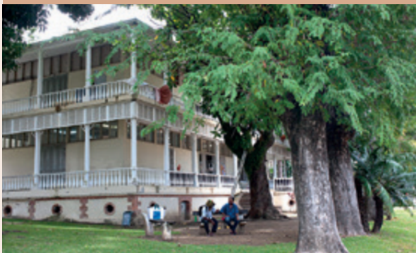
La bibliothèque Bernheim, installée dans un bâtiment de style colonial ayant servi de pavillon de la Nouvelle-Calédonie lors de l'Exposition universelle de 1900 à Paris, est un établissement public de la Nouvelle-Calédonie.

Les membres des assemblées de Provinces sont élus par le corps électoral spécial (citoyens de la Nouvelle-Calédonie) au scrutin de liste à la représentation proportionnelle suivant la règle de la plus forte moyenne.