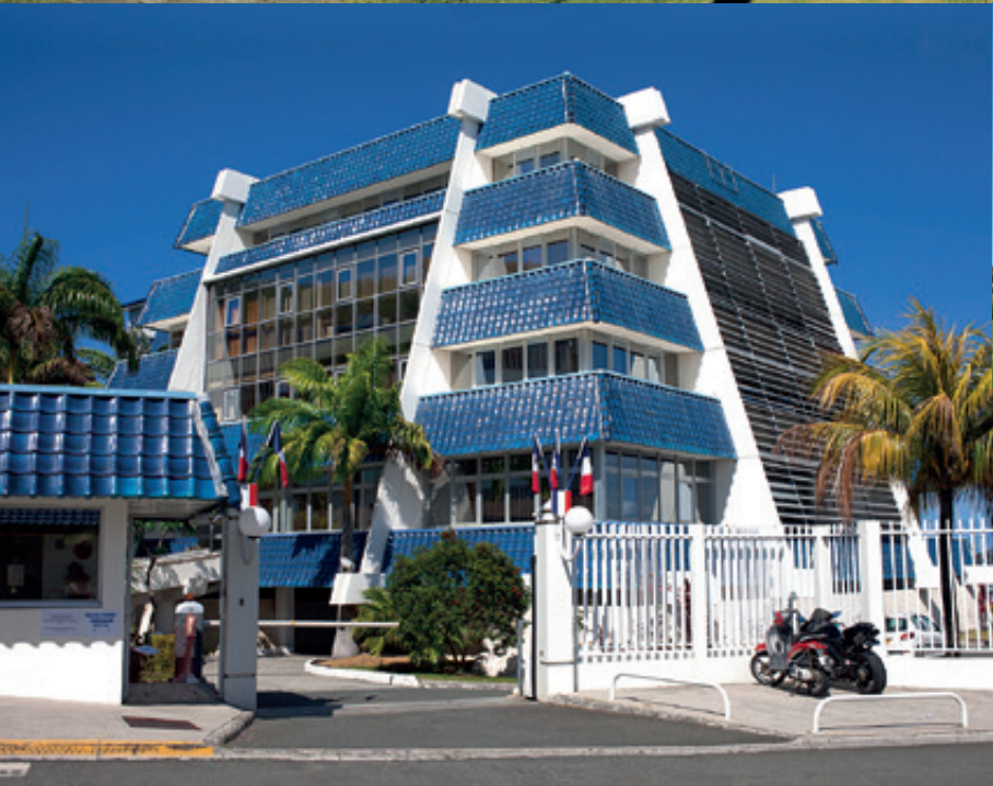
CI-CONTRE L'hôtel de la Province des Îles Loyauté à Wé (en haut) celui de la Province Sud à Nouméa (en bas).

«Nous voulions faire des Provinces un outil de rééquilibrage. Il fallait donc leur donner de vraies compétences (...) On a renversé le principe : les compétences qui ne reviendraient pas à l'État ou aux communes iraient à ces collectivités appelées Provinces pour bien montrer le changement (...) Il y a eu une discussion très ardue sur les limites entre les Provinces Nord et Sud. La commune de Poya a dû être coupée en deux sur le fameux "Creek Amick"». Michel Rocard, Premier ministre de mai 1988 à juin 1991, signataire des accords de Matignon-Oudinot