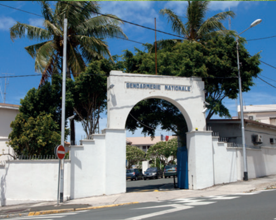
La caserne Gally-Passebosq, située place Bir-Hakeim, abrite les bureaux de l'armée et la caserne Meunier, le commandement de la gendarmerie.