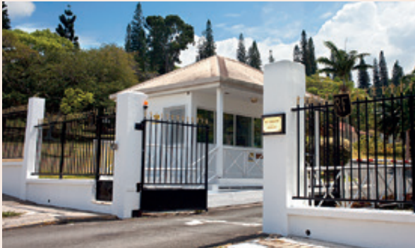
Entrée du haut-commissariat à Nouméa.

Il prévoit d'organiser d'ici à fin 2018, dernier mandat de l'accord de Nouméa, un référendum sur l'accession à la pleine souveraineté. En vertu du gel du corps électoral, seules seront consultées les personnes justifiant de vingt ans de résidence sur le territoire.