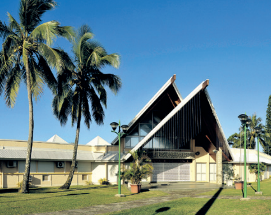
L'hôtel de la Province Nord et sa case traditionnelle.