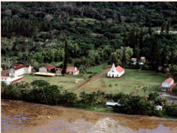
Yaté, située au sud de la Grande Terre, est petite par sa population, mais elle est la 15 e commune la plus vaste de France.

Jusqu'en 1969, Nouméa a été la seule commune de plein exercice de Nouvelle-Calédonie. Il existe aujourd'hui 33 communes. Leurs délimitations tiennent compte de celles des aires coutumières et des Provinces, à l'exception de la commune de Poya. Un tiers seulement d'entre elles compte plus de 3 500 habitants.