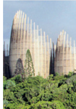
Centre culturel Tjibaou.

Le programme économique et social, financé par l'État, est conçu pour réduire les déséquilibres entre d'un côté l'intérieur de la Grande Terre et les Loyauté et de l'autre Nouméa.