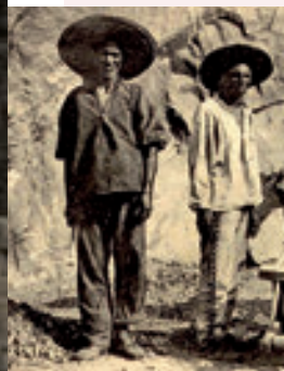
Condamnés aux travaux forcés, avec chaînes.

À partir de la prise de possession française, le 24 septembre 1853, ce sont essentiellement des bagnards français, les transportés (puis les déportés politiques, dont les Kabyles et les délinquants récidivistes relégués), qui viennent peupler la jeune colonie. Parallèlement, la « colonisation libre » est encouragée. Après les colons anglo-saxons invités par James Paddon, des Français arrivent d'Alsace-Lorraine, de l'île de la Réunion, du nord de la France, sous l'impulsion des gouverneurs successifs.