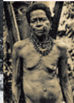
Femme de La Foa fumant la pipe.

Du xv e au xviii e siècle, quelques familles venues, selon la tradition orale, de l'île Wallis touchèrent Ouvéa. Repoussées à deux reprises, elles s'installèrent sur l'île Ounès, avant de se fixer pour de bon dans le nord et le sud de l'île d'Iaai, qui prit le nom polynésien de leur île d'origine, Ouvéa. L'immigration wallisienne reprit, par bateau et par avion cette fois, dans la deuxième partie du xx e siècle, stimulée par les besoins en main-d'œuvre des secteurs du bâtiment et de la mine. Aujourd'hui encore, Wallisiens et Futuniens quittent leurs îles trop petites. Ils sont maintenant plus nombreux en Nouvelle-Calédonie que sur leur terre d'origine.