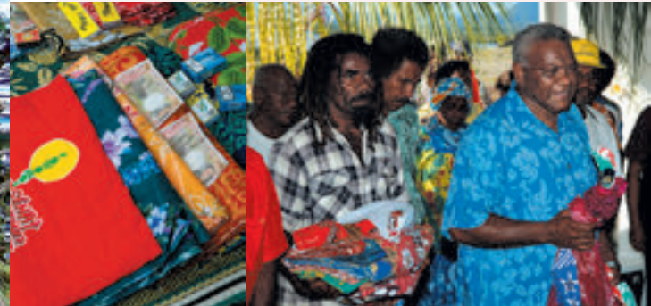
Le geste coutumier, Vavouto.

Le clan , qui regroupe des individus se reconnaissant un ancêtre commun, est à la base de l'organisation sociale kanak. La vie de la communauté, très structurée, est rythmée par les activités sociales et agricoles qui se déroulent selon un calendrier précis, le calendrier de l'igname . La culture de ce tubercule associé au masculin (contrairement au taro, féminin), joue un rôle prépondérant. La mise en terre et surtout la récolte des ignames donnent lieu à de grandes cérémonies festives.