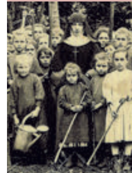
Internat de la Fonwhary, région de La Foa.