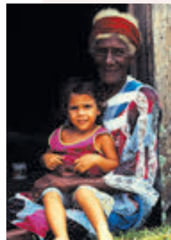
Sourires de l'île de Tiga.

Selon les projections démographiques de l'Institut de la statistique et des études économiques (ISEE), la population de la Nouvelle-Calédonie en 2030 sera plus vieille mais toujours plus concentrée autour de Nouméa. La collectivité comptera environ 312 000 habitants , dont un sur cinq aura plus de soixante ans, contre un sur dix actuellement. L'espérance de vie à la naissance sera de 77,6 ans pour les hommes et 83,3 ans pour les femmes, et l'âge médian dépassera les 36 ans, contre 28 ans en 2005. Pour la première fois dans l'histoire moderne de la région, et grâce à un taux de croissance démographique deux fois supérieur, la population du Vanuatu dépassera celle du Caillou avec 384 000 habitants.