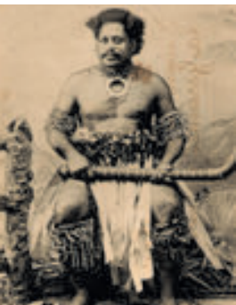
Un chef fidjien en costume de guerre.

La Reine de Port de France, Nouméa en 1856.