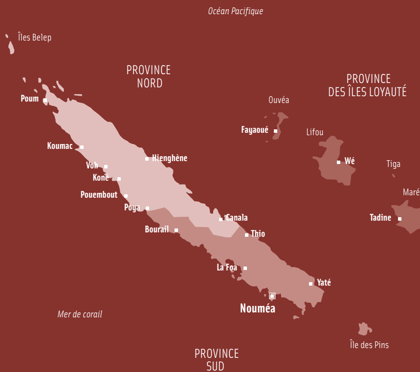
LES PROVINCES ET PRINCIPALES LOCALITÉS DE NOUVELLE-CALÉDONIE