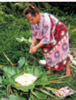
Femme kanak préparant le bougna.

La gastronomie néo-calédonienne est le miroir de cette diversité. Parmi les plats les plus populaires : le nem, d'origine vietnamienne, le bami, d'origine indonésienne, la salade de poisson cru et le poé, d'origine polynésienne, les acras, d'origine antillaise, les achards, d'origine réunionnaise... Ces recettes importées rivalisent avec le bougna kanak , mélange de viande ou de poissons et de tubercules cuits à l'étouffé, et les traditions gastronomiques françaises ou encore méditerranéennes.