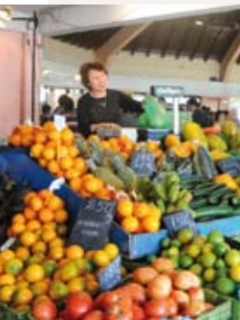
Le marché de Nouméa se tient chaque jour baie de la Moselle. Les plans de piments, les bouquets de fleurs, les légumes frais côtoient les fruits tropicaux.

Ce maillage, source d'activité et de lien social, répond aux besoins de proximité des populations. Le secteur des services à la personne a enregistré, en 2008, la plus forte progression sous l'impulsion des métiers de nettoyage de locaux, de réparation automobile et de secrétariat.