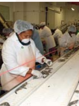
Conditionnée dans les ateliers de la SOPAC, la crevette calédonienne a été élue « saveur de l'année 2008 » par un jury international.

Compétente en matière de commerce extérieur, la Nouvelle-Calédonie a choisi de protéger de la concurrence ses entreprises industrielles et ses activités agricoles afin de compenser le handicap dû à l'étroitesse de son marché intérieur de seulement 250 000 habitants.