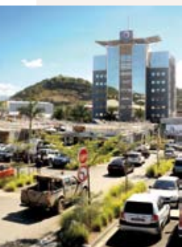
La presqu'île de Ducos est devenue, au fil des ans, la première zone industrielle et artisanale du pays, mais aussi un pôle commercial important.

Objectif prioritaire des accords politiques de Matignon et Nouméa, le rééquilibrage du territoire est en marche. Soutenu par des infrastructures performantes – réseau routier et électrique, téléphone et internet, hôpitaux et dispensaires – le pays multiplie les initiatives pour tenter de répartir équitablement les populations et les activités économiques.