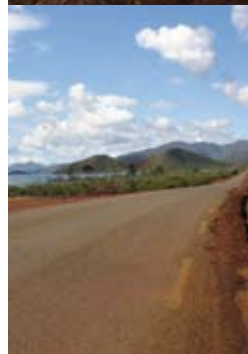
Mine de Poya en province Nord.