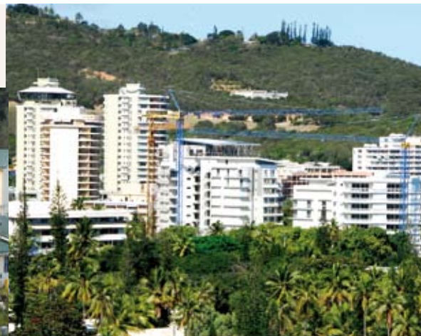
Logements sociaux à Nouméa. © province Sud

La pression démographique stimule la demande de logements dans l'agglomération nouméenne. © province Sud