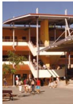
Collège d'Auteuil.

Le développement humain (enseignement, culture, Université, IUFM, Jeux du Pacifique, jeunesse et sports), représente environ 40 % de l'effort de l'État (524,4 millions d'euros), suivi par l'aide fiscale (216 millions) et la représentation de l'État sur le territoire (haut-commissariat, Trésor public et pensions avec 203,5 millions d'euros). Le constat est sans appel : sans ces transferts, la Nouvelle-Calédonie s'étiolerait.