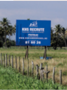
L'usine du Nord, en grand besoin de main-d'œuvre, recrute dans tout l'archipel.

Sur la côte est, l'agriculture occupe une place prépondérante, tant en termes de population active ou de production agricole, qu'en termes d'organisation