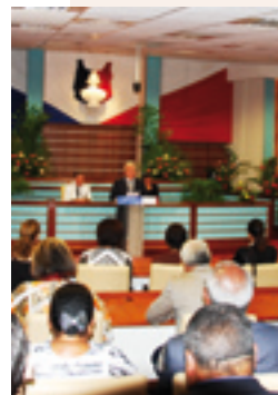
La salle du Congrès de la Nouvelle-Calédonie.

La réunion des trois assemblées de Provinces, élues au suffrage universel, forme le Congrès qui tient, en quelque sorte, le rôle d'une instance parlementaire fédérale. Le Congrès gère les affaires communes à l'ensemble du territoire : fiscalité, répression des fraudes, réglementation des prix, principes directeurs du droit à l'urbanisme, procédure civile, organisation des services territoriaux, réglementation en matière de santé, d'hygiène publique et protection sociale.