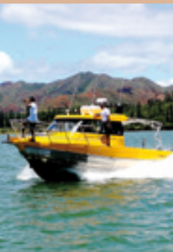
Le lagon fait l'objet d'une surveillance attentive de la part des autorités provinciales.

plutôt européen et loyaliste, le financement des trois Provinces est volontairement déséquilibré. La loi référendaire du 9 novembre 1988 stipule que les recettes fiscales de la Nouvelle-Calédonie seront réparties de la manière suivante : 50 % pour le Sud, 32 % pour le Nord et 18 % pour les Îles Loyauté pour les dotations de fonctionnement. En matière d'équipement, la répartition s'établit à 40 % pour le Sud, 40 % pour le Nord et 20 % pour les Îles. Cependant, après vingt ans de flux migratoire des Provinces Nord et des Îles Loyauté vers la Province Sud, les limites de la clé de répartition se manifestent aujourd'hui par un déficit structurel du budget de la Province Sud. Indépendamment des contrats quinquennaux de développement, l'État verse aux Provinces une dotation globale de fonctionnement, essentiellement pour la santé et l'enseignement.