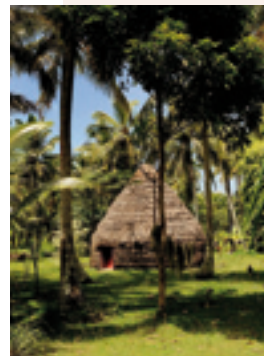
Case de Lifou.

Pour les jeunes entrepreneurs des îles Loyauté, la coutume est moins un frein qu'un socle sur lequel s'appuyer pour entreprendre. Tout est permis à celui qui respecte les fondamentaux de la culture kanak, de tradition orale. Ainsi, tout projet d'aménagement se développe en concertation avec le clan propriétaire du terrain et le grand chef. Les entrepreneurs favorisent le travail à temps partiel afin de permettre à leurs employés d'assurer leurs travaux coutumiers et concilier ainsi économie moderne et économie traditionnelle.