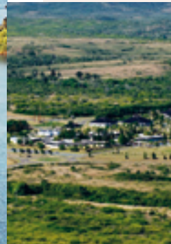
Le complexe des bâtiments administratifs de la Province Nord à Koné.

La Province Nord, la plus étendue (9 582,6 km 2 ) mais aussi la moins densément peuplée (45 137 habitants en 2009 soit 4,7 habitants/km 2 ), comprend un peu plus de la moitié nord de la Grande Terre ainsi que les îles Belep. Koné, son chef-lieu, est aussi la commune la plus peuplée. Ses habitants sont à 80 % kanak. Traversée du nord au sud par une chaîne montagneuse aux flancs raides et aux arêtes escarpées, la Province Nord offre deux visages bien distincts. Sur la côte ouest, sous le vent, de vastes plaines consacrées à l'élevage extensif de bovins et à quelques cultures maraîchères, s'étalent jusqu'au bord de mer. La côte est, zone plus humide à la végétation exubérante, est le domaine de l'agriculture vivrière encore rythmée par le cycle de l'igname et autres tubercules. Les forêts impénétrables des basses vallées laissent place en hauteur aux fougères arborescentes et aux pins colonnaires endémiques. La côte est perd des habitants, qui migrent vers Nouméa ou l'autre versant de la chaîne, où la construction d'une gigantesque usine métallurgique et des multiples infrastructures d'accompagnement procurent de nombreux emplois en même temps que des perspectives extraordinaires de développement.