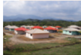
Lotissement, construit à Baco sur du foncier coutumier, pour accueillir les salariés de l'usine du Nord.

La réalisation de la zone artisanale de Baco est le premier exemple de la volonté des instances coutumières et des clans de participer au développement. Il devrait faire école.