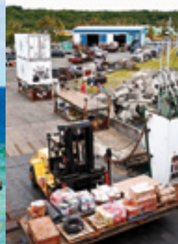
Le port de Wé (Lifou).

La Province compte également nombre de petits élevages, surtout familiaux, de porcs et de volailles. Maré est la plus agricole des îles de l'archipel avec une prédominance de productions fruitières (avocats, letchis), de productions vivrières marchandes