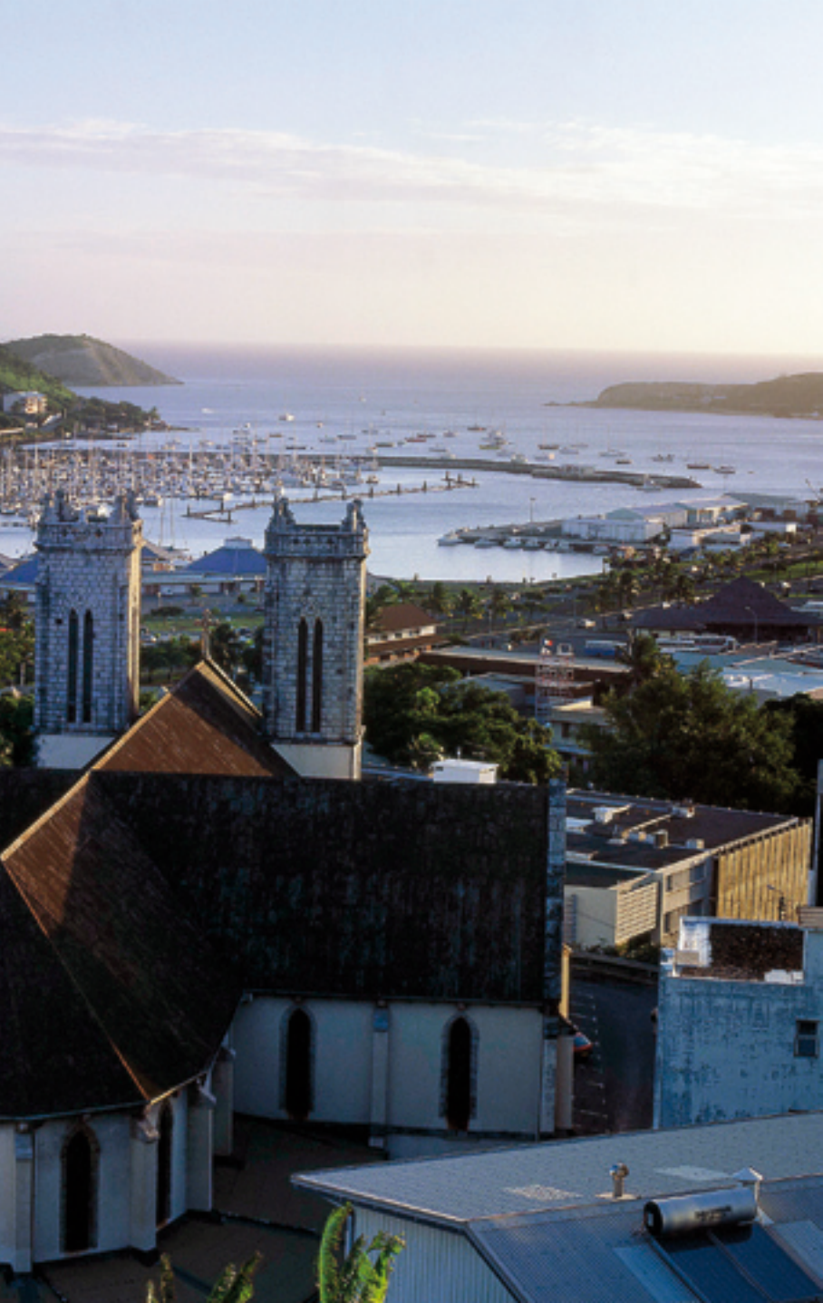
Vue générale de Nouméa.

Bien que majoritairement européenne, la population de la Province Sud est extrêmement diversifiée. Les Océaniens (Kanak, Wallisiens et Futuniens, Polynésiens et Ni-Vanuatu), les Asiatiques (Vietnamiens, Chinois, Indonésiens) et les Européens (nés en Nouvelle-Calédonie ou plus récemment arrivés de Métropole) forment un étonnant kaléidoscope, reflet des ambitions d'un peuple à la recherche de son destin commun. Cet arc-en-ciel humain, hérité des différentes vagues de peuplement, se déploie essentiellement à Nouméa où la mixité ethnique débute sur les bancs de l'école et se poursuit grâce à une vie culturelle et sportive intense et variée. Le centre culturel Tjibaou, le musée de la Ville de Nouméa, le musée de la Nouvelle-Calédonie, mais aussi le théâtre de l'Île et les centres culturels du Mont-Dore et de Païta multiplient les actions pour faire vivre cette pluralité. En brousse, les communautés sont géographiquement plus séparées. Bourail, centre agricole important depuis