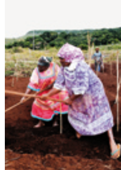
La Nouvelle-Calédonie compte 245 580 habitants, dont les deux-tiers vivent en Province Sud.

le Territoire en trois Provinces : Nord, Sud et Îles Loyauté . Les légitimités issues de l'histoire se sont ainsi partagé les responsabilités politiques et économiques du pays. Les indépendantistes ont accédé à l'exercice du pouvoir dans le Nord et les Îles Loyauté, les non-indépendantistes ont gardé la gestion de Nouméa et de la Province Sud. En créant trois collectivités, dotées d'institutions puissantes, les accords de Matignon indiquaient clairement qu'il existait en Nouvelle-Calédonie d'autres lieux de pouvoir que Nouméa. Koné, dans le Nord, et Lifou, aux Îles Loyauté, devenaient des capitales administratives, le siège d'assemblées délibérantes aux budgets importants et aux exécutifs influents.