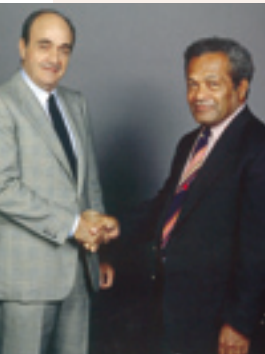
Jacques Lafleur, député loyaliste et Jean-Marie-Tjibaou, leader des indépendantistes, scellent par une poignée de main historique les accords de Matignon (1988).

En mai 1988, la signature des accords de Matignon – entre l'État français, et les partis pro et anti-indépendantistes – a rétabli la paix civile et découpé