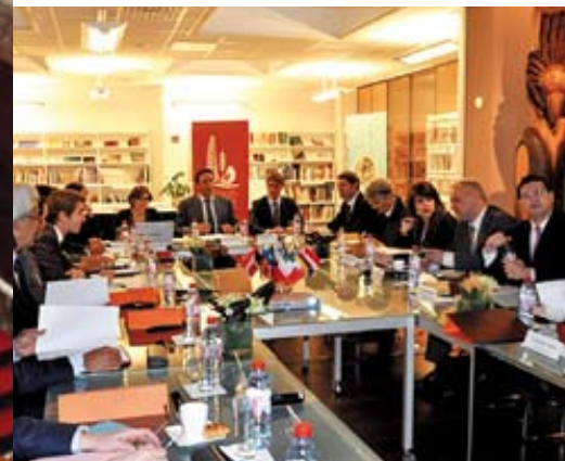
CI-CONTRE Deux députés de Nouvelle-Calédonie siègent à l'Assemblée Nationale.