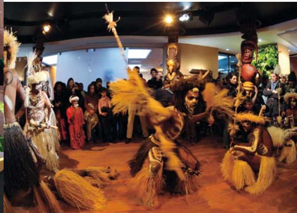
CI-CONTRE ET DOUBLE PAGE SUIVANTE Danse traditionnelle par la troupe Olobatr (île des Pins) lors de l'inauguration de la Maison de la Nouvelle-Calédonie en novembre 2008.

La Maison de la Nouvelle-Calédonie est chargée d'assurer la promotion du pays en Métropole et, plus largement, en Europe. Elle représente également les intérêts des institutions politiques de Nouvelle-Calédonie (Gouvernement, Congrès et Provinces). Les différents publics en quête d'informations sont accueillis chaque jour à la Maison de la Nouvelle-Calédonie. Ils peuvent aussi obtenir des renseignements par téléphone et par internet. Pour plus de facilité, « Nouvelle-Calédonie Tourisme » ainsi que la compagnie Air Calédonie International sont hébergés dans les locaux de la Maison de la Nouvelle-Calédonie.