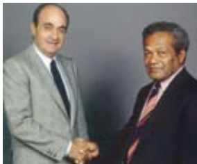
Accords de Matignon, 1988 : la poignée de main entre Jacques Lafleur et Jean-Marie Tjibaou, symbole de la paix retrouvée entre les communautés.

Classement du récif calédonien à l'Unesco, salons, transferts de compétences, lois du pays... Tout au long de l'année, les dossiers traités à Paris et les événements importants nécessitent le déplacement des missions calédoniennes.