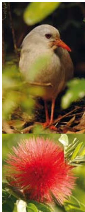
Le cagou ( Rhynochetus jubatus ), oiseau endémique et emblème de la Nouvelle-Calédonie.

Avec moins de 12 habitants/km 2 , la Nouvelle-Calédonie offre beaucoup d'espaces vierges. 230 000 habitants ont été recensés en 2004, dont un tiers avait moins de 15 ans. 71 % des habitants vivent en province Sud, principalement à Nouméa et ses proches environs.