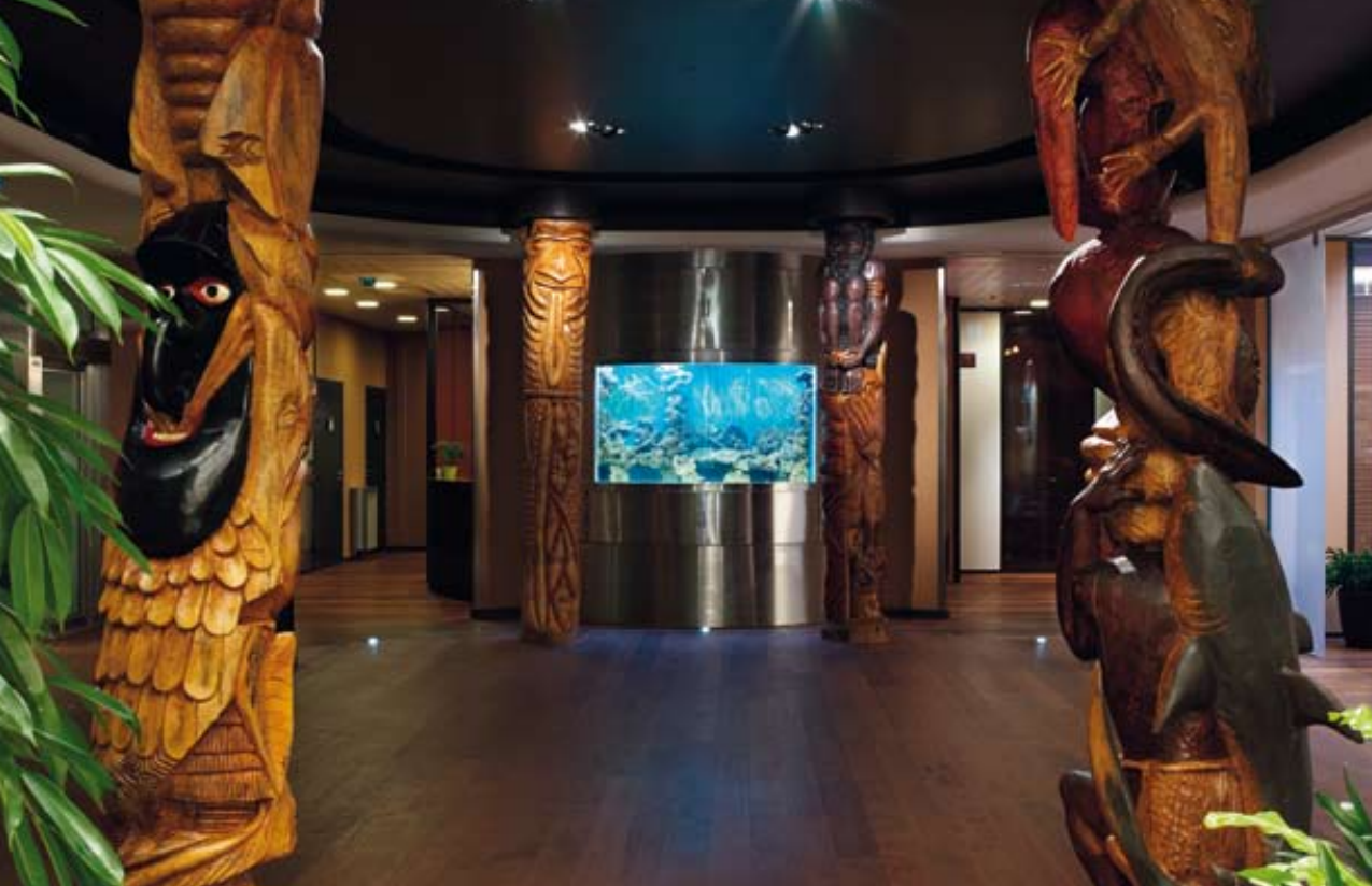
L'espace circulaire de la case peut être utilisé comme plateau scénique.