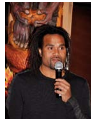
Ambassadeur de l'archipel, le champion Christian Karembou était à l'honneur à la Maison de la Nouvelle-Calédonie pour la parution de son autobiographie, en février 2011.

Les artistes calédoniens s'y produisent, soit dans le cadre d'une tournée en France ou en Europe, soit exclusivement, avec des créations inédites. En juin 2009, à l'occasion du vernissage de l'exposition « Mélanésia 2000 », commémorant les vingt ans de la disparition de Jean-Marie Tjibaou, des artistes calédoniens ont créé spécialement un spectacle vivant.