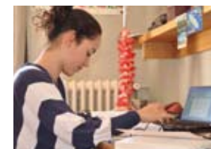
Les jeunes Calédoniens sont de plus en plus nombreux à venir en France métropolitaine pour leurs études.

Outre les pertes financières (billet d'avion, bourse...) pour la collectivité et les familles, les désistements venaient alourdir le nombre de Calédoniens non diplômés sur le marché du travail. Un soutien pédagogique personnalisé est assuré pour les étudiants calédoniens des provinces Îles et Nord ainsi que pour ceux relevant des programmes « cadres Avenir » et « Après-bac service » par l'Aceste (Association calédonienne d'enseignement scientifique, technique et économique) en partenariat avec le CNAM (Conservatoire national des arts et métiers). Les étudiants boursiers de la province Sud peuvent bénéficier d'un suivi pédagogique et d'un accompagnement social assurés par un prestataire en Métropole.