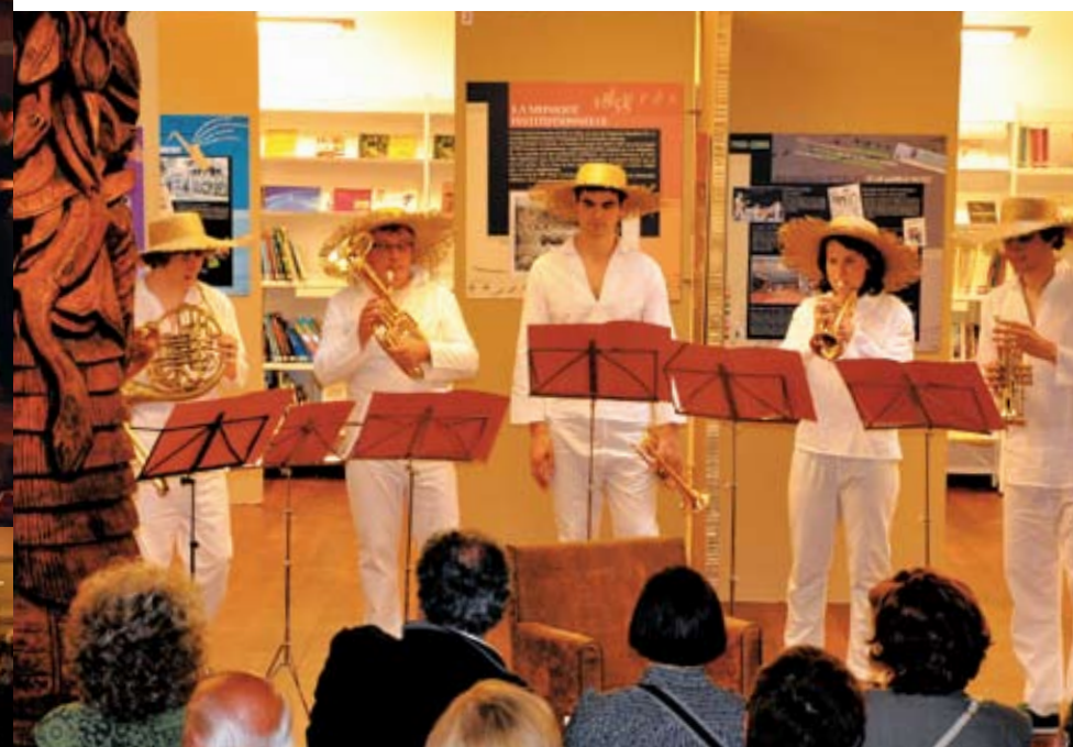
Une fanfare a joué les anciens airs du bain calédonien à l'occasion de la Fête de la Musique le 21 juin 2010.

La Maison de la Nouvelle-Calédonie soutient aussi les projets culturels initiés par les associations calédoniennes.