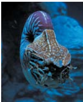
Le nautilus ( Nautilus macromphalus ) est un mollusque des profondeurs.

☉ La savane : elle est présente sur 40 % de la surface de l'archipel. Apparue après l'arrivée de l'homme, elle résulte du défrichage des forêts humides ou sèches. C'est le domaine du niaouli, des cerfs et des cochons sauvages.