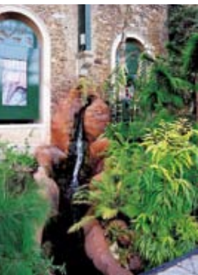
Une des grandes serres du Jardin des Plantes de Paris est, depuis juin 2010, entièrement dédiée à la Nouvelle-Calédonie. Elle a pu être réalisée grâce au soutien des collectivités calédoniennes et avec le concours de la Maison de la Nouvelle-Calédonie à Paris.