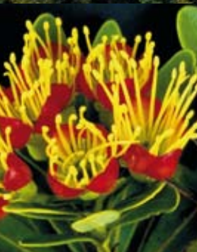
Des végétaux uniques au monde se sont développés dans l'archipel ( Xanthostenon aurantiacum ).