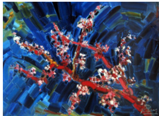
"Prunus". Huile sur toile au couteau, 73x54.