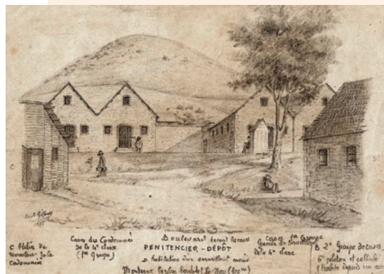
Croquis du bagne par l'auteur

La bastonnade donnée, le patient est reconduit en cellule où un infirmier lui fait des applications d'eau blanche. Telle fut mon arrivée à l'île Nou, c'est l'usage chaque fois qu'un convoi vient d'arriver, de faire assister les nouveaux à cette correction, pour leur faire comprendre qu'ils n'ont qu'à marcher droit. La correction se donne pour bien des motifs : réponse inconvenante à un surveillant, paresse au travail, pédérastie, absence du camp au moment des appels. Le premier surveillant venu peut faire un rapport mensonger, il est cru, le condamné n'est pas interrogé, on prononce sur son sort d'une manière irrévocable. J'aurai à signaler plus d'un abus de ce genre. Le quatrième jour, je fus conduit à la forge ainsi que les hommes du convoi, l'anneau de fer que nous portions depuis Toulon nous fut enlevé. Je me trouvai libre de ce fer que je portai depuis sept mois. »