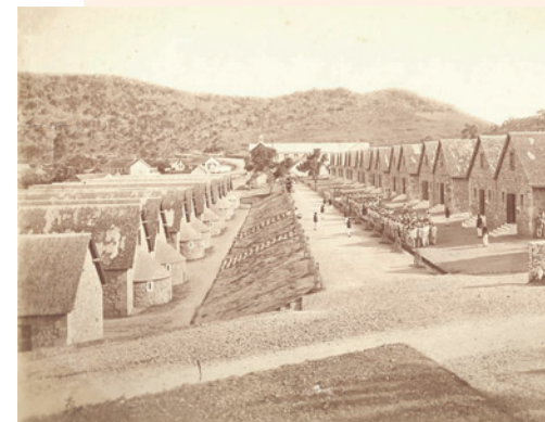
Bagne de l'île Nou

déshumanisation, l'univers sadique des punitions et exécutions au grand air, en un mot la folie de ce monde inversé qu'on a bâti aux antipodes.